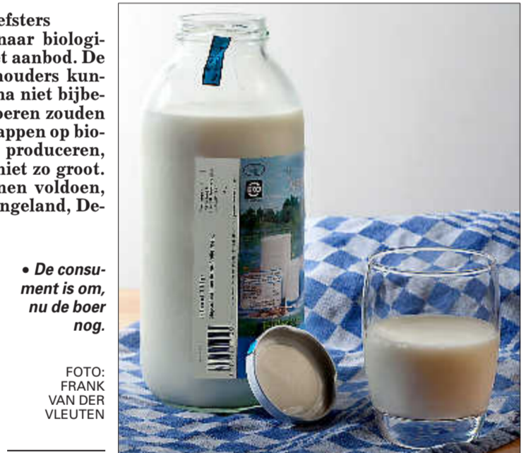
• De consumptie is om, nu de boer nog.

Biologisch gehouden koeien moeten bijvoorbeeld kunnen grazen in de wei. En ze krijgen biologisch voer dat duurder is dan de gewone variant. Ook krijgt biologisch gehouden melkvee minder krachtvoer, waardoor de dieren wat minder melk geven dan in de reguliere melkveehouderij. En op een biologisch bedrijf moeten grotere en ruimere stallen staan om de dieren meer bewe-