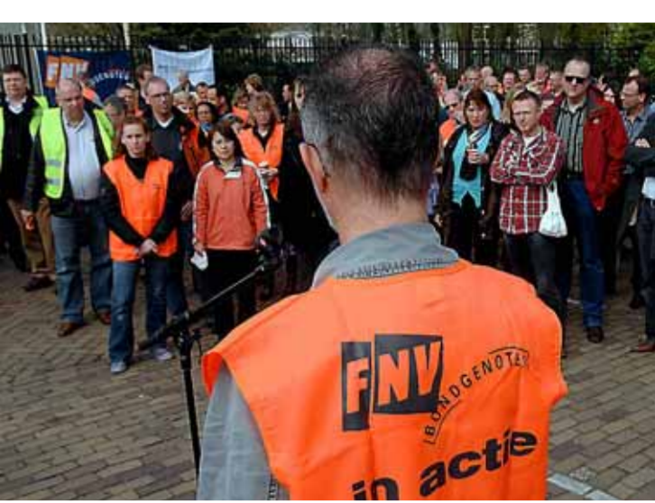
• Naast koopkrachtcompensatie komt ook de ruzie over het pensioenakkoord op de cao-tafel.

Van onze verslaggevers AMSTERDAM - Het traditionele wapengekletter in de polder voor het komende cao-seizoen is alweer begonnen. Maar de ruzie over het pensioenakkoord en de radicalisering binnen een deel van de vakbondorganisatie kunnen de komende tijd wel eens leiden tot harde confrontaties. De grootste vakbond van Nederland is helder: „Ze kunnen hun borst nat maken.”